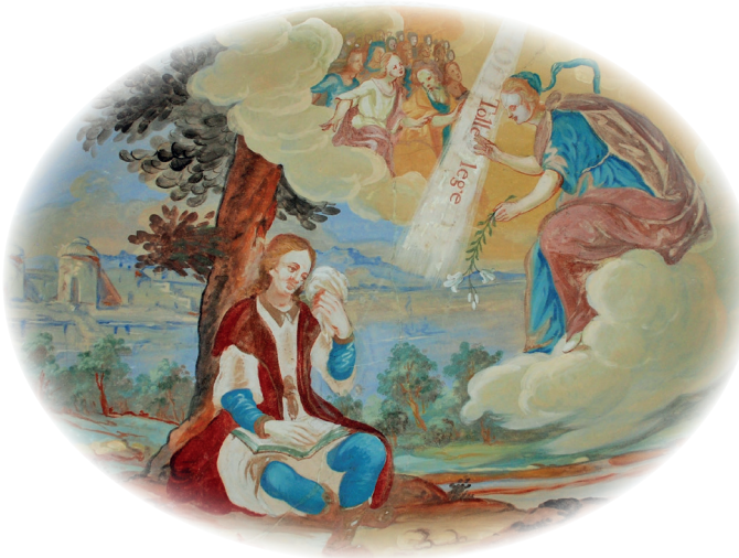
Ausschnitt Deckenfresco im Kloster Wettenhausen: „Tolle lege“

Jeder Teilnehmer erhält in diesen Tagen eine persönliche Begleitung.