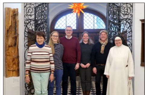
(Bild 8 unten: neuer Vorstand Freundeskreis Kloster Wettenhausen e.V.)